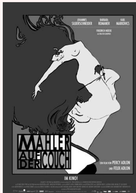
Filmplakat zu „Mahler auf der Couch“