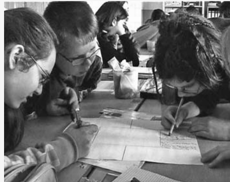
Schülergruppe der Herbert-Grillo-Gesamtschule in Duisburg-Marxloh, einer der FÖRMIG-Modellschulen

In der Ringvorlesung werden namhafte Experten und Expertinnen aus verschiedenen Ländern zu diesen Fragen Stellung nehmen und Forschungsergebnisse präsentieren.