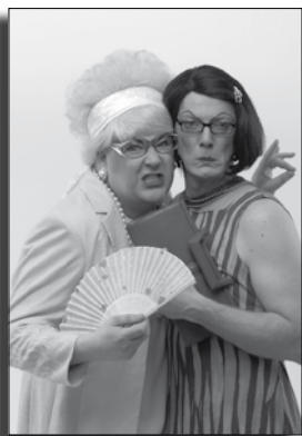
Didine und Blessless

Mit der Unsicherheit, der Irritation der Zuhörerschaft, spielen die beiden „Tuntendarstellerinnen“ meisterhaft. Dabei helfen ihnen ihre Professionalität, eine gute Portion Schlagfertigkeit, breite Allgemeinbildung und Sprachsensibilität. Katharina Stegelmann, Daniel Plettenberg