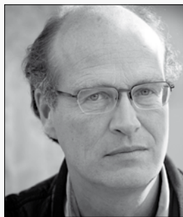
Joachim Lux ist seit der Spielzeit 2009/2010 Intendant des Thalia Theater Hamburg.