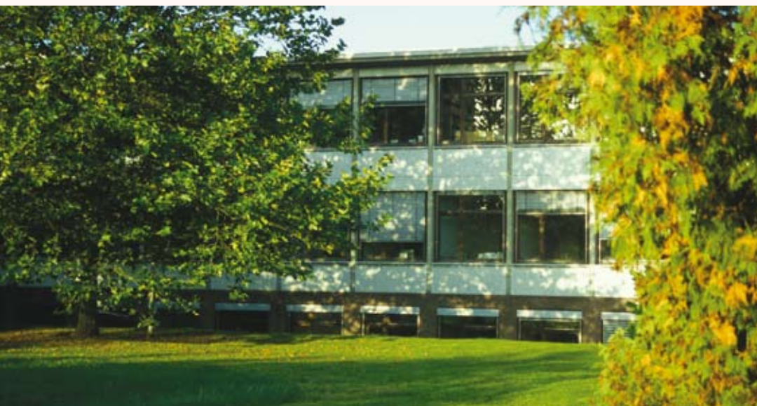
Idylle in der Großstadt: Die AWW befindet sich auf dem Campus Stellingen am Niendorfer Gehege

Vogt-Kölln-Str. 30, Haus E 22527 Hamburg Tel. 040/42883-2499, Fax 040/42883-2651 info@aww.uni-hamburg.de