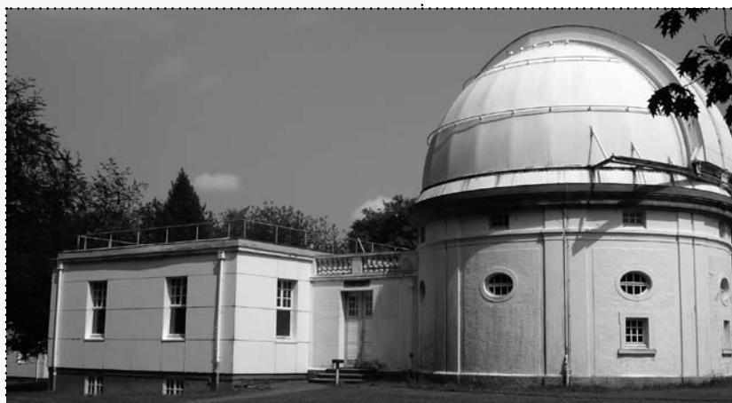
Sternwarte Bergedorf von 1910: kulturhistorisch bedeutsames Ensemble von internationalem Rang

Weitere Highlights bilden die „Lange Nacht der Museen“ am 16. Mai unter dem Motto „Die Sterne zeigen den Weg – Astronomie und Navigation“, der „Tag der offenen Tür“ in der Hamburger Sternwarte am 13. Juni und die „6. Lyrische Mondnacht“ am 29. August. In der Ausstellungswoche historischer Sternwarten vom 18. bis 28. Juni werden Führungen