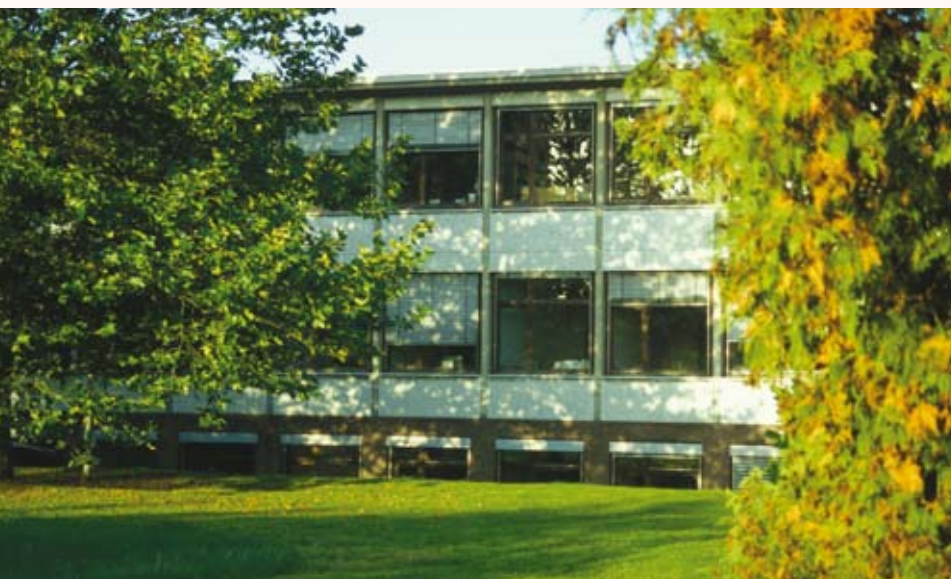
Idylle in der Großstadt: Die AWW befindet sich auf dem Campus Stellingen am Niendorfer Gehege

Vogt-Kölln-Str. 30, Haus E 22527 Hamburg Tel. 040/42883-2499, Fax 040/42883-2651 info@aww.uni-hamburg.de