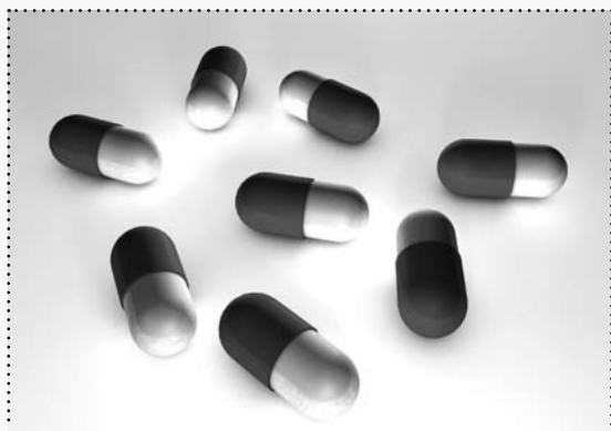
Arzneien sind aus dem Leben des 21. Jahrhunderts nicht mehr wegzudenken.