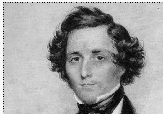
Felix Mendelssohn Bartholdy im Alter von 30 Jahren