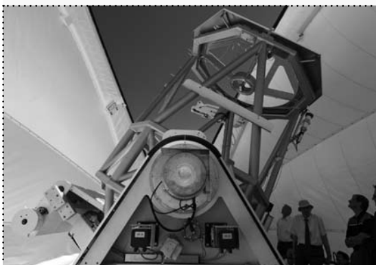
Sonnenteleskop GREGOR auf Teneriffa